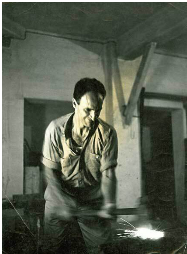
EDUARDO CHILLIDA TAILERREAN SORTZEN. 1951.

Aldi berean, gaztaroan Realeko atezaina izan zen; 19 urterekin hasi zen bere hiriko taldean jokatzeko. Zaleek «katua» izena jarri zioten, baloiaren bila bizkor salto egiten zuelako. Baina futbola utzi behar izan zuen belauneko lesio bat zela eta. Hala ere, atezainak baloia gelditzeko behar dituen ezaugarriak eskulturara eraman zituen, hots, espazioa eta denbora kontrolatzeko gaitasuna.