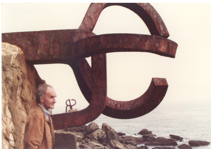
EDUARDO CHILLIDA HAIZEAREN ORRAZIAREN ONDOAN XV.