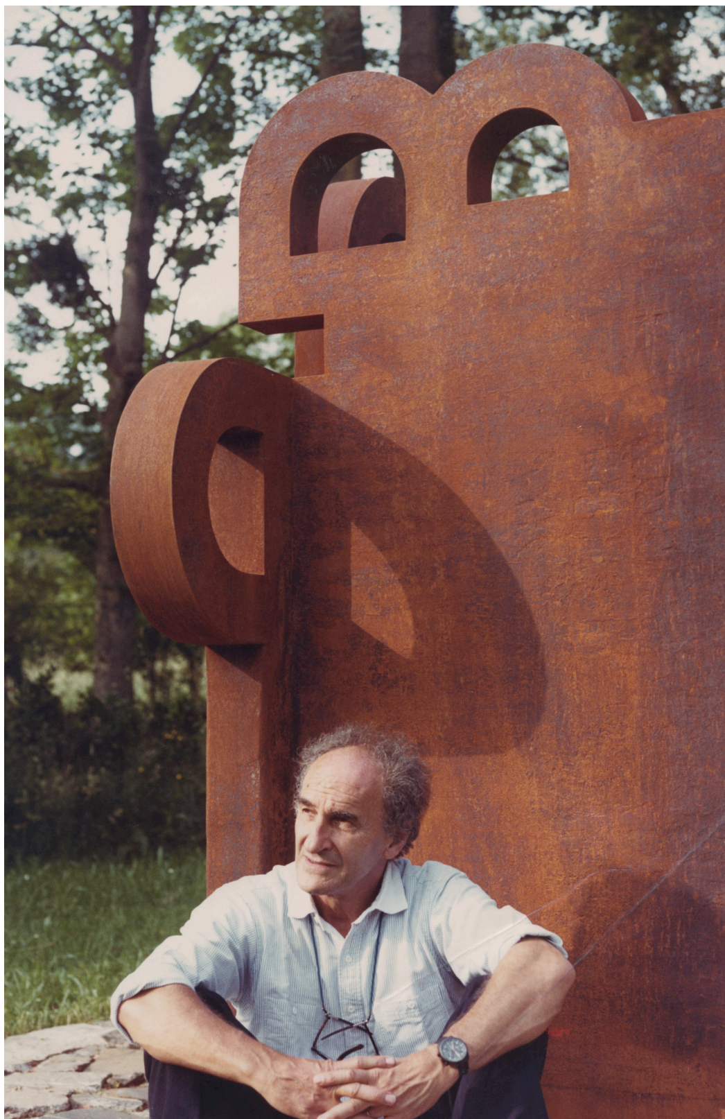
EDUARDO CHILLIDA TOPOS V. AREKIN ZABALAGAN.