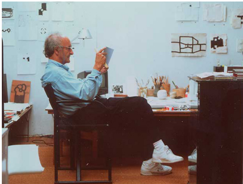
EDUARDO CHILLIDA BERE INGEBOG ESTUDIOAN. 1990.

Eduardo Chillida - Pilar Belzunce Fundazioak bultzatu du oroitzapen-proiektu hau. Duela bi hamarkada sortu zen erakundea, eskultorearen obraren ezagutzan sakontzeko eta haren ikerketa eta zabalkundea sustatzeko. Bertan, Kultura eta Kirol Ministerioak parte hartzen du, 2022ko martxoaren 3an Ministerioak eta Eduardo Chillida - Pilar Belzunce Fundazioak kultura-proiektuetan lankidetzan aritzeko sinatutako protokoloaren baitan. Protokolo hori Ministerioaren eta Fundazioaren arteko lankidetzaren garatzeko abiapuntu gisa sinatu zen, Eduardo Chillidaren jaiotzaren mendeurrenarekin lotuta.