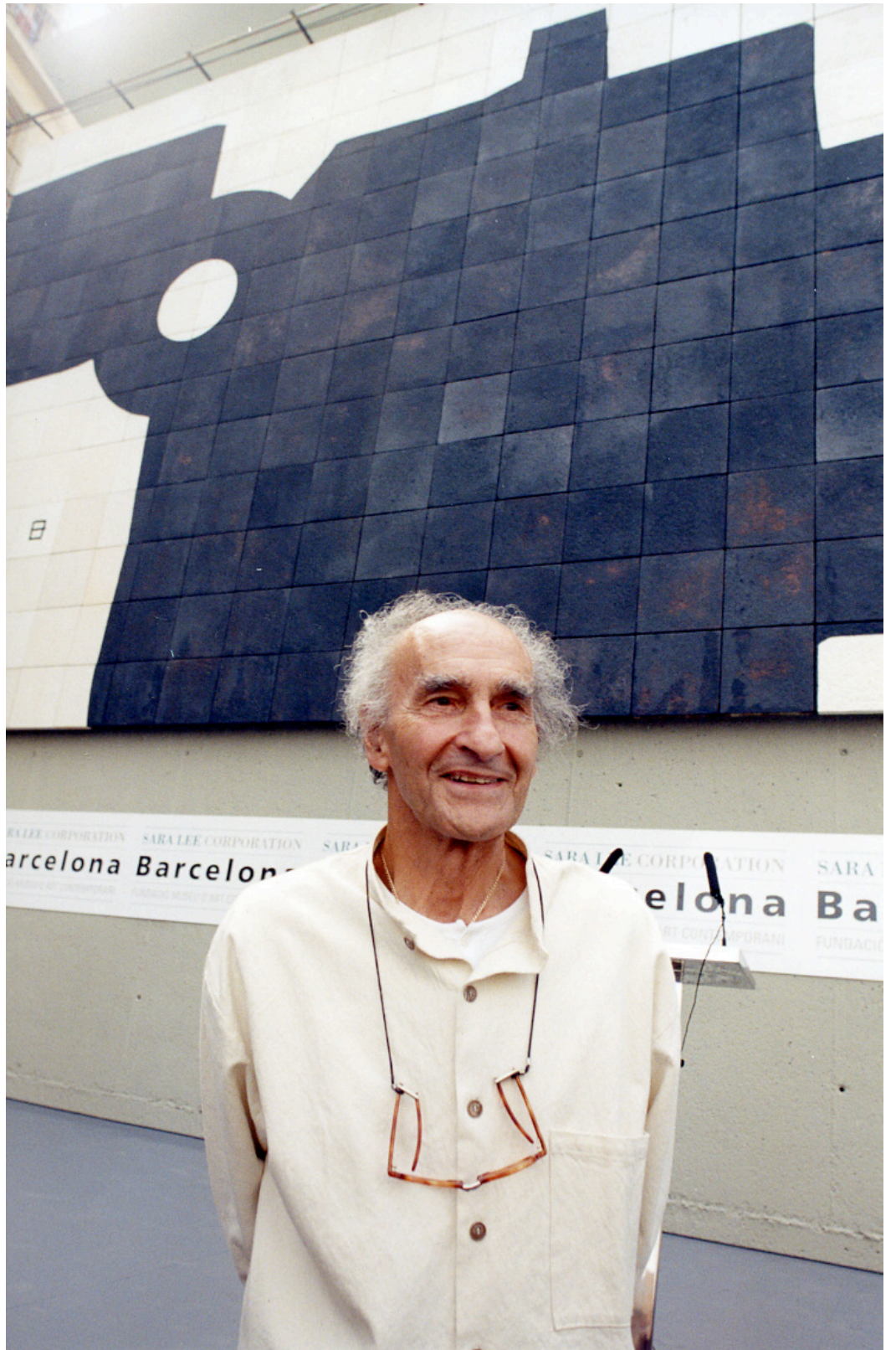
EDUARDO CHILLIDA BARTZELONAN, MURAL G-333 MACBAN, BARTZELONAN. 1998. EDUARDO CHILLIDA ARTXIBOAREN ARGAZKIA.