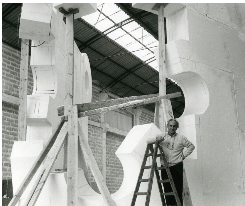
EDUARDO CHILLIDA GURE AITAREN ETXEAN, 1986.